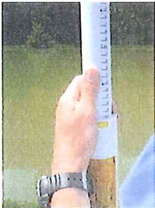
Gemessener Bodenabstand zur Hochspannungsleitung beträgt 7,3 m