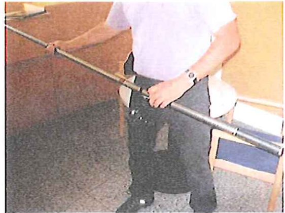
In der Polizeiinspektion Aschach/Donau konnte die unfallverursachende Kohlenfaser-Angelrute begutachtet werden