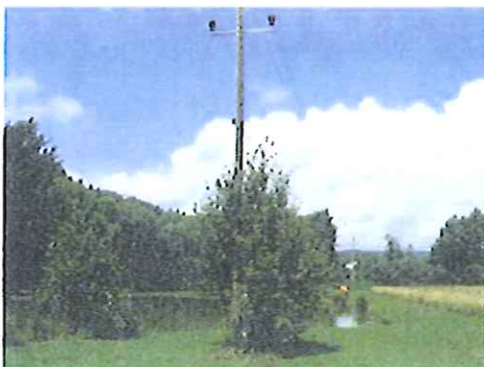
Teichabschnitt - Unfallstelle