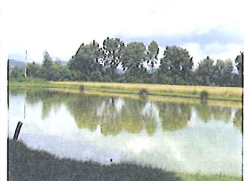
Teichabschnitt - gegenüber liegend