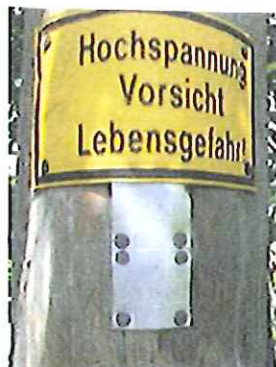
Energie AG - Hinweis